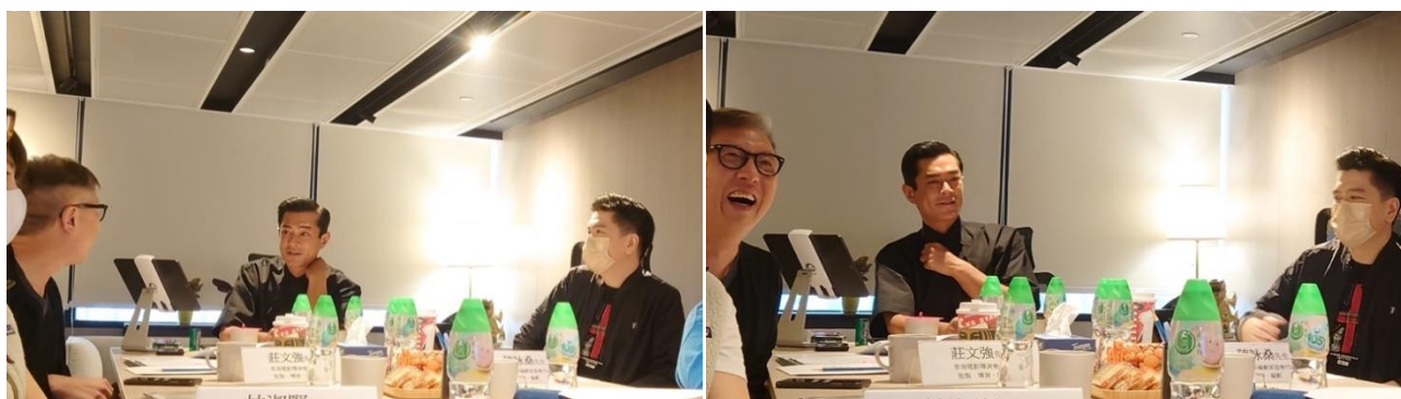
(上圖) 古天樂、莊文強與陳詠燊與眾主創團隊面試時互相交流。

基於 2022 年上半年疫情反覆，同時為讓劇本修改及籌備有更充裕的時間，第一季作品籌備工作稍為推遲，務求精益求精。因此，第二季申請將稍延至 2022 年第四季公佈，敬請密切留意。